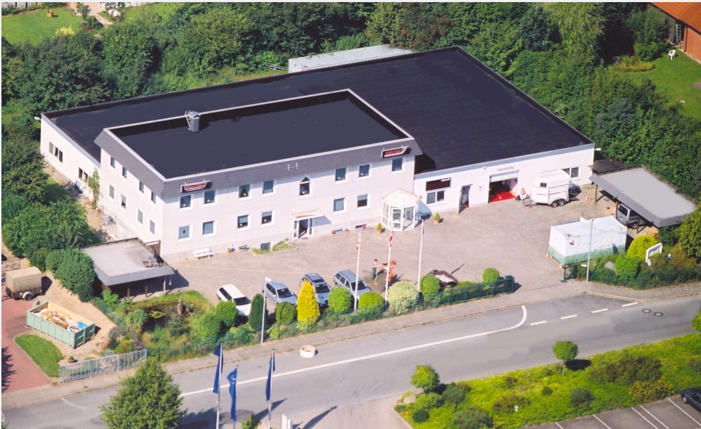
MEM-O-MATIC - Hauptstandort Bad Segeberg / Schleswig-Holstein